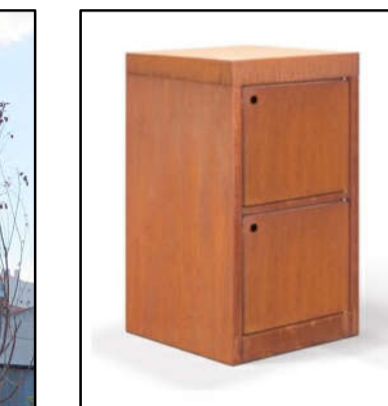
⑤ E-Bike-Ladestation (mit extensiver Deckelbegrünung möglich)