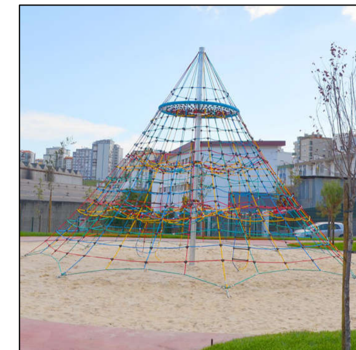
④ Kletterpyramide 650