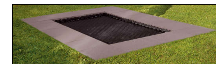
① Bodengleiches Trampolin