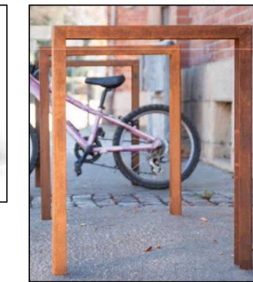
⑥ Fahrradständer Cortenstahl