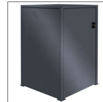
⑩ Strom- u. Wasseranschlusskasten, abschließbar