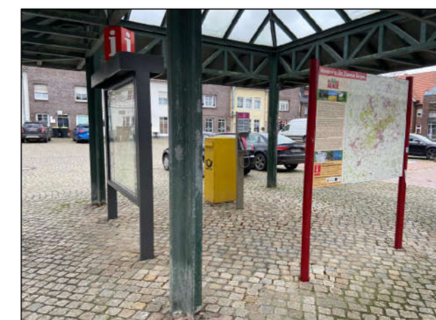
⑭ Pavillon Bestand