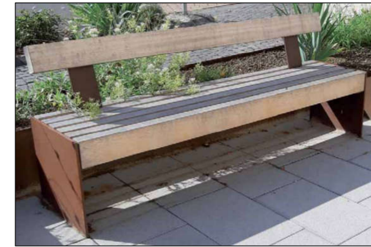
⑧ Sitzbank mit Lehne