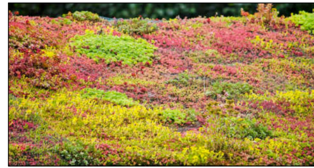
① Extensive Dachbegrünung