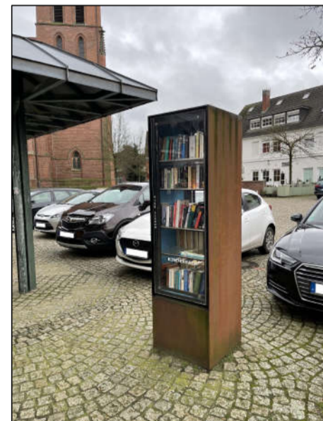
⑥ Bücherregal Bestand