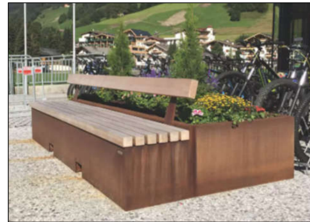
④ Sitzbank-Pflanzkübel-Kombination mit Lehne