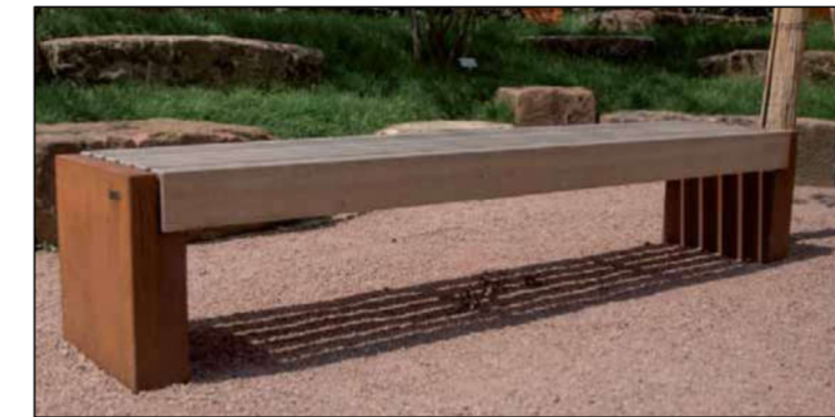
⑧ Sitzbank ohne Lehne