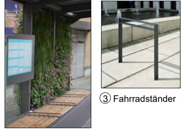
② Vertikalbegrünung mit integrierter Beregnung und Umrahmung